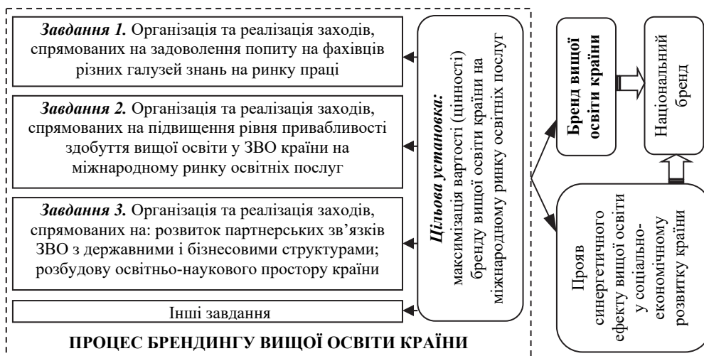
Рис. 3. Цільова установка та основні завдання брендингу вищої освіти

Така багатовекторність завдань у процесі брендингу вищої освіти потрібна для створення та підтримки не просто привабливого бренду вищої освіти у межах реалізації стратегії її розвитку в країні, а для того, щоб цей бренд приносив синергетичний ефект у межах реалізації загальної стратегії соціально-економічного розвитку цієї країни та позитивно впливав на сприйняття національного бренду країни у світі.