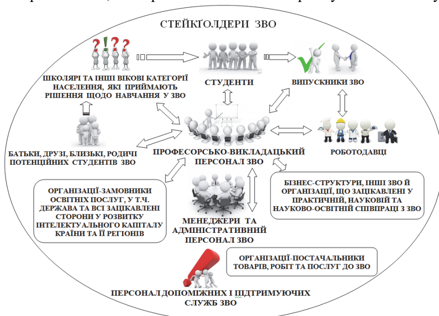
Рис. 2. Стейкхолдери закладу вищої освіти як основні суб'єкти сприйняття його бренду (результатів брендингу)

Визнання ЗВО у світі та кількість і частота його вибору для навчання та/або реалізації наукових та науково-освітніх проєктів зміцнюють бренд ЗВО на міжнародному ринку освітніх послуг. Водночас бренд ЗВО впливає на формування HR -бренду тих, хто там навчається та/або працює, а сформований HR -бренд випускників ЗВО виявляється та впливає на конкурентоспроможність організацій (підприємств), куди вони йдуть працювати. Аспекти використання HR -бренду як інструменту для підвищення рівня конкурентоспроможності підприємств уже досліджувалися деякими науковцями [17 та ін.]. Проте це цілком стосується і ЗВО, оскільки HR -бренд(и) працівників ЗВО прямо впливає і на конкурентоспроможність, і на привабливість ЗВО на ринку освітніх послуг.